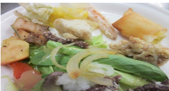
★ひと皿に盛り合わせてみました★