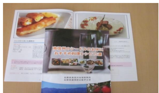
「南信州シードルのお伴におすすめ料理レシピ15選」